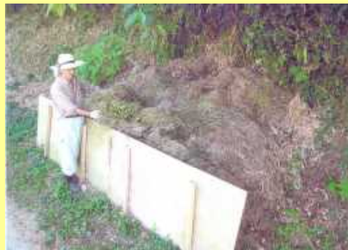
草をたい肥として利用