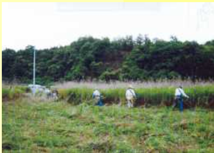
遊休農地の保全管理