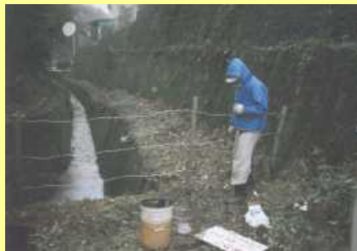
ため池裏口侵入防止策設置