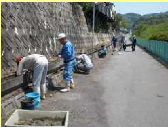
水路の補修（目地詰め・破損箇所改