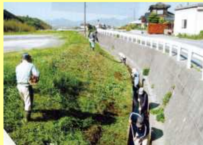
水路の泥上げ・草刈